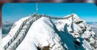
พิชิต 3 ยอดเขาดัง Rigi / Schilthorn / Glacier 3000