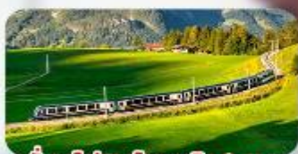
นั่งรถไฟสายโรแมนติก 2 สาย Golden Pass / Luzern Interlaken Express