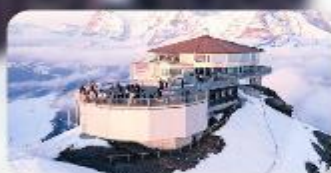
ทานอาหารที่ Piz Gloria ทัศนียภาพที่ทิวทัศน์ได้ 360 องศา