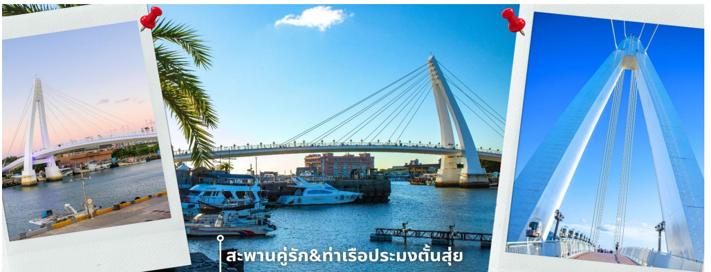
สะพานคู่รัก&ท่าเรือประมงต้นสุ่ย

สมควรแก่เวลานำท่านเดินทางไปยัง เมืองต้นสุ่ย ชมแลนด์มาร์กสุดโรแมนติกของเมืองต้นสุ่ย ตั้งอยู่บริเวณท่าเทียบเรือประมงต้นสุ่ย ซึ่งเป็นอีกหนึ่งจุดท่องเที่ยวริมอ่าวที่ขึ้นชื่อของเมืองนิวไทเป เดิมทีเคยเป็นท่าเรือประมงเก่า ก่อนจะถูกพัฒนาให้กลายเป็นแหล่งพักผ่อนและท่องเที่ยวริมทะเลที่มีเสน่ห์เฉพาะตัว บรรยากาศเงียบสงบ รายล้อมไปด้วยวิวทะเลกว้างและลมเย็นสบาย เหมาะสำหรับการเดินเล่นชมวิวและดื่มด่ำกับความโรแมนติกของเมือง แลนด์มาร์กของท่าเรือประมงแห่งนี้คือ สะพานคู่รักต้นสุ่ย ที่โดดเด่นด้วยโครงสร้างทรงเรือใบสีขาวที่ทอดยาวกว่า 196 เมตร เปิดใช้งานครั้งแรกในวันวาเลนไทน์ ปี ค.ศ. 2003 จึงกลายเป็นสัญลักษณ์แห่งความรักที่คู่รักและนักท่องเที่ยวต่างหลงใหลมาชมความงดงาม ที่นี้ขึ้นชื่อเรื่องวิวพระอาทิตย์ตกที่สวยงามที่สุดแห่งหนึ่งของไต้หวัน