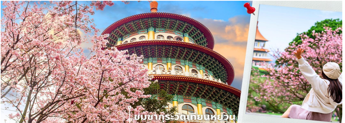
ชมซากุระวัดเทียนหยวน

หลังรับประทานอาหารเที่ยง นำท่านเดินทาง ชมความงามดอกซากุระบานวัดเทียนหยวน ตั้งอยู่ในเขตต้าถง เมืองนิวไทเป (New Taipei City) เป็นหนึ่งในสถานที่ท่องเที่ยวที่มีชื่อเสียงของไต้หวัน โดยเฉพาะในช่วงฤดูใบไม้ผลิ ที่นี่จะกลายเป็น แลนด์มาร์กชมซากุระที่ใหญ่ที่สุดแห่งหนึ่งของไต้หวัน ดึงดูดนักท่องเที่ยวทั้งชาวไต้หวันและต่างชาติให้มาเยี่ยมชมทุกปี ตัววัดมีความโดดเด่นด้วย เจดีย์ทรงกลม 5 ชั้น ที่มีสถาปัตยกรรมผสมผสานระหว่างวัฒนธรรมจีนแบบดั้งเดิมกับความสง่างามทันสมัย รอบ ๆ วัดถูกโอบล้อมด้วยภูเขาและธรรมชาติ ทำให้บรรยากาศเงียบสงบและร่มรื่น เหมาะแก่การพักผ่อนและดื่มด่ำกับความงดงามของธรรมชาติ ให้ท่านอิสระถ่ายภาพตามอัธยาศัย