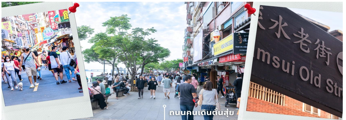
ถนนคนเดินต้นสุ่ย

เมื่อแสงสุดท้ายของวันสะท้อนผิวน้ำและทอดยาวไปบนสะพานสีขาว เกิดเป็นภาพโรแมนติกที่ดึงดูดให้ผู้คนมารอเก็บภาพความทรงจำ และเมื่อถึงยามค่ำคืน สะพานแห่งนี้จะสว่างไสวด้วยแสงไฟหลากสีที่เปลี่ยนโฉมบรรยากาศให้เต็มไปด้วยเสน่ห์ที่ไม่ว่าช่วงกลางวัน รอบ ๆ ยังรายล้อมไปด้วยร้านอาหารทะเลสด คาเฟ่ และมุมพักผ่อนริมอ่าวที่ทำให้การมาเยือนเต็มไปด้วยรสชาติและบรรยากาศที่น่าจดจำ ให้ท่านอิสระตามอัธยาศัย ก่อนจะพาท่านเดินทางไปยังถนนคนเดินต้นสุ่ย ตั้งอยู่เลียบบแม่น้ำต้นสุ่ย บรรยากาศเต็มไปด้วยความคึกคักทั้งกลางวันและยามเย็น ถนนสายนี้ขึ้นชื่อเรื่องของกินเล่นและขนมพื้นเมืองที่มีให้เลือกนับไม่ถ้วน ไม่ว่าจะเป็น ปลาเสียบไม้ย่าง (Grilled Fish Cake), เต้าหู้เหม็น, ไช้เหล็ก (Iron Egg) ของขึ้นชื่อประจำถิ่น รวมไปถึงไอศกรีมซอฟต์เสิร์ฟแห่งยาวพิเศษที่เป็นอีกหนึ่งเมนูยอดฮิตของนักท่องเที่ยว นอกจากอาหารแล้ว ถนนคนเดินแห่งนี้ยังเต็มไปด้วยร้านขายของที่ระลึก ร้านขนมพื้นเมืองและสินค้าน่ารัก ๆ ให้เลือกซื้อกลับไปเป็นของฝาก หรือจะเดินเล่นชมบรรยากาศริมแม่น้ำก็ดีไม่แพ้กัน โดยเฉพาะช่วงพระอาทิตย์ตกที่ถนนสายนี้จะคึกคักเป็นพิเศษเพราะนักท่องเที่ยวมักมารวมตัวกันเพื่อชมวิวยาว ๆ ริมน้ำ ให้ท่านอิสระเลือกชม ช้อป ถ่ายภาพ ตามอัธยาศัย