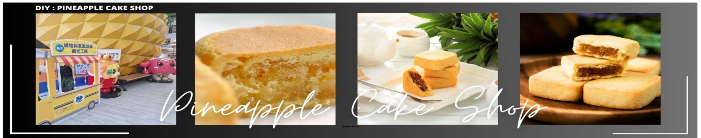
Pineapple Cake Shop

เช้า รับประทานอาหารเช้า ณ โรงแรมที่พัก (2) นำท่านแวะชมของที่ระลึก ผลิตภัณฑ์สร้อย Germanium ซึ่งทำเป็นเครื่องประดับทั้งสร้อยคอและสร้อยข้อมือซึ่งมีการฝังแร่ Germanium ลงไปมีคุณสมบัติ ลดผลกระทบจากรังสีจากอุปกรณ์อิเล็กทรอนิกส์ปรับความสมดุลในระบบต่างๆของร่างกาย นำทุกท่านแวะชิม ขนมพายสับปะรด (Pineapple Cake Shop) เค้กพายสับปะรด เป็นขนมชื่อดังประจำชาติของไต้หวันที่มีเอกลักษณ์เฉพาะตัว มีรสชาติกลมกล่อม แป้งมีความหอมและไส้สับปะรดเยอะ นอกจากนี้ยังมีขนมอื่นๆอีกมากมาย เช่น พายเผือก, ตังเม ให้ทุกท่านได้เลือกชิมเลือกซื้อเป็นของฝากกลับบ้าน