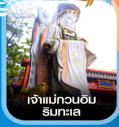
เจ้าแม่กวนอิม ริมทะเล