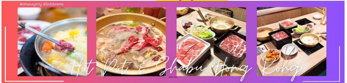
Hot Pot & Shabu Hong Kong