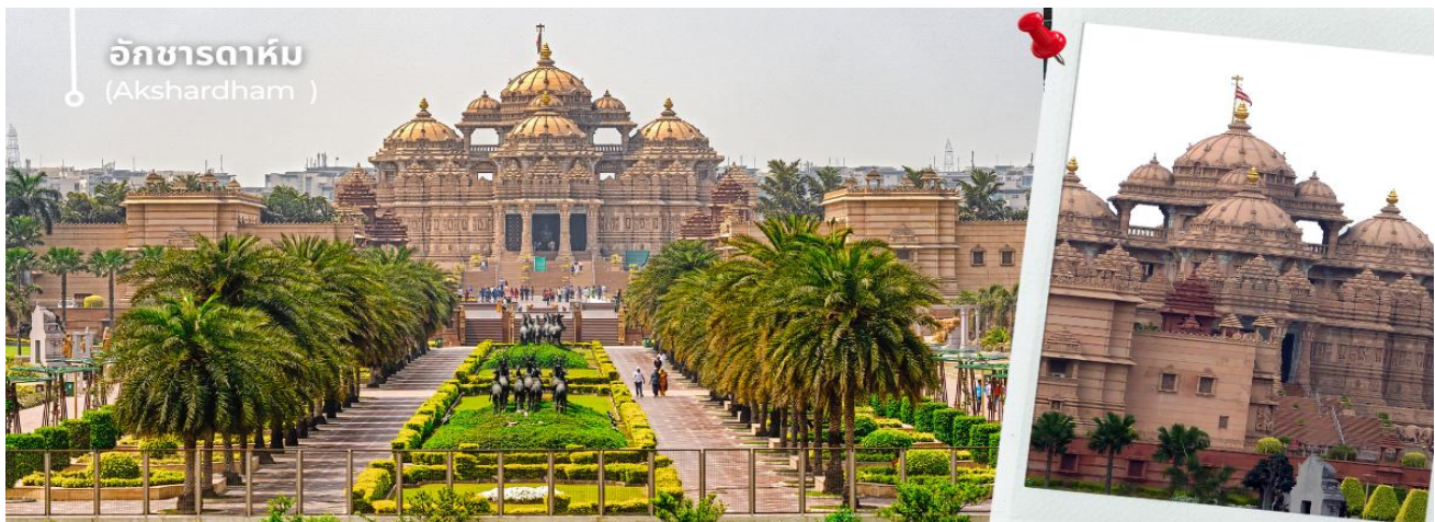
อักชาร์ดาม ( Akshardham )

นำท่านเดินทางสู่ อักชาร์ดาม (Akshardham) วัดแห่งศาสนาฮินดูที่ใหญ่ที่สุดในโลก และเป็นวิทยาลัยทางจิตวิญญาณและวัฒนธรรม สถานที่สำคัญประจำจากรัฐเดลีแห่งประเทศอินเดีย และยังเป็นที่ยู้งึกในชื่อเดลีอักชาร์ดัม (Delhi Akshardham) หรือ สวามินารายันอักชาร์ดัม (Swarminarayan Akshardham) วัดแห่งนี้ เป็นวัดที่สร้างขึ้นใหม่แห่งศาสนาฮินดูนิกายสวามินารายัน โดยชื่ออักชาร์ดามมีความหมายว่า ที่พำนักของพระเจ้าแห่งโลก ออกแบบในสไตล์สถาปัตยกรรมดั้งเดิมของอินเดีย ที่มีความซับซ้อนแต่ก็ปราณีตสวยงามสมคำร่ำลือใหญ่อลังการแบบวัดอินเดีย ดึงดูดเหล่าสาวกและนักท่องเที่ยวให้มาบูชาและชื่นชมความตระการตาของวัดแห่งนี้มากมายในทุกๆปี