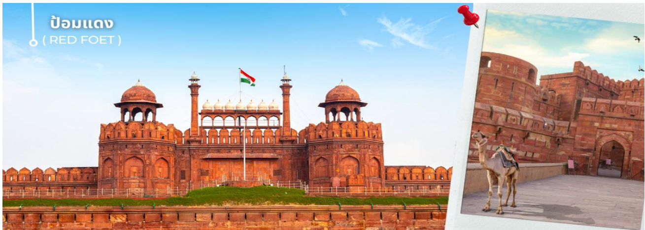
ป้อมแดง ( RED FOET )

นำท่านเดินทางไปยัง ป้อมแดง มรดกอันโดดเด่นของสถาปัตยกรรมโมกุลอันเลื่องชื่อ ป้อมแห่งนี้ตั้งอยู่ในใจกลางเมืองหลวง เป็นการผสมผสานระหว่างสถาปัตยกรรมตะวันตก อิสลาม และฮินดู สะท้อนให้เห็นถึงการพัฒนาอันรุ่งโรจน์ของยุคศักราชโมกุล ในตอนเย็น การแสดงแสงและเสียงที่บอกเล่าประวัติศาสตร์ของป้อมแห่งนี้ก็เป็นประสบการณ์ที่ไม่ควรพลาด