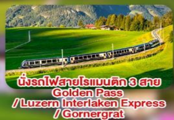
นั่งรถไฟสายโรแมติก 3 สาย Golden Pass / Luzern Interlaken Express / Gornergrat