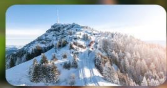
พิชิต 3 ยอดเขาดัง Rigi / Schilthorn / Gornergrat