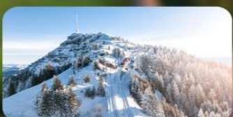
พิชิต 3 ยอดเขาดัง Rigi / Schilthorn / Gornergrat