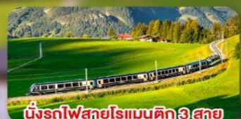
นั่งรถไฟสายโรแมติก 3 สาย Golden Pass / Luzern Interlaken Express / Gornergrat