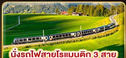
นั่งรถไฟสายโรเมนติก 3 สาย Golden Pass / Luzern Interlaken Express / Gornergrat