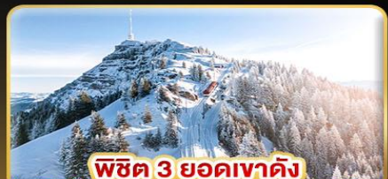
พิชิต 3 ยอดเขาตั้ง Rigi / Schilthorn / Gornergrat