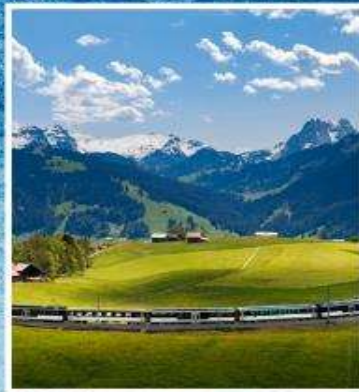
GOLDEN PASS LINE Montreux-Zweisimmen