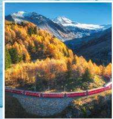
BERNINA EXPRESS Unesco