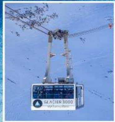
GLACIER3000 Peak walk by Tissot