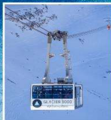
GLACIER3000 Peak walk by Tissot