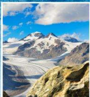
ALETCH GLACIER Riederalp, Bettmeralp