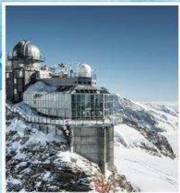
JUNGFRAUJOCH "Top of Europe"