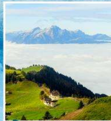
RIGI KULM Queen of the Mountains