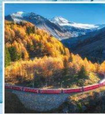
BERNINA EXPRESS Unesco