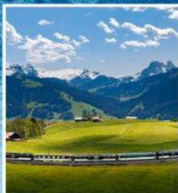
GOLDEN PASS LINE Montreux-Zweisimmen