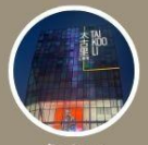
ช้อปปิ้ง ซานหลี่ถุน