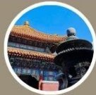
มูเตลสุดปัง วัดลามะ