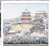
พระราชวังฤดูร้อน อวิเหอหยวน