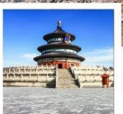
หอบูชาเทียนถาน