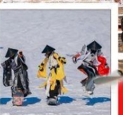
จวินตุซาน สกี รีสอร์ท