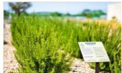
The Mediterranean Garden