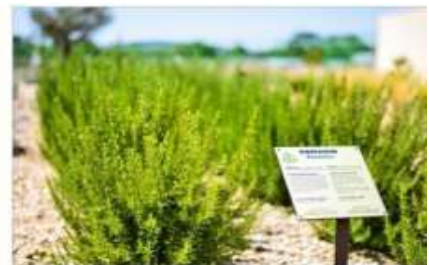
The Mediterranean Garden