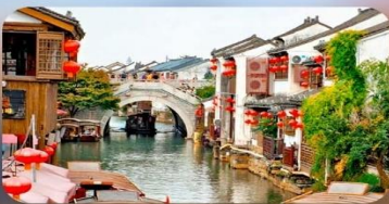
ถนนโบราณซีหลีซานกง