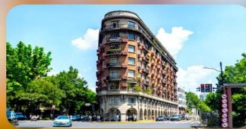
ถนนอู๋คิง