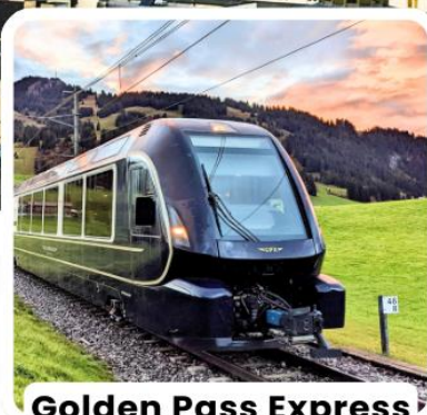
Golden Pass Express