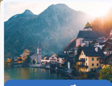
ออสเตรีย