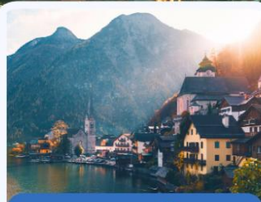
ออสเตรีย