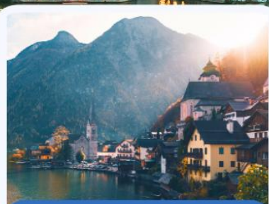
ออสเตรีย