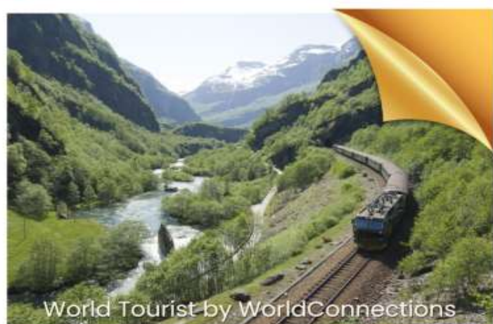
World Tourist by WorldConnections