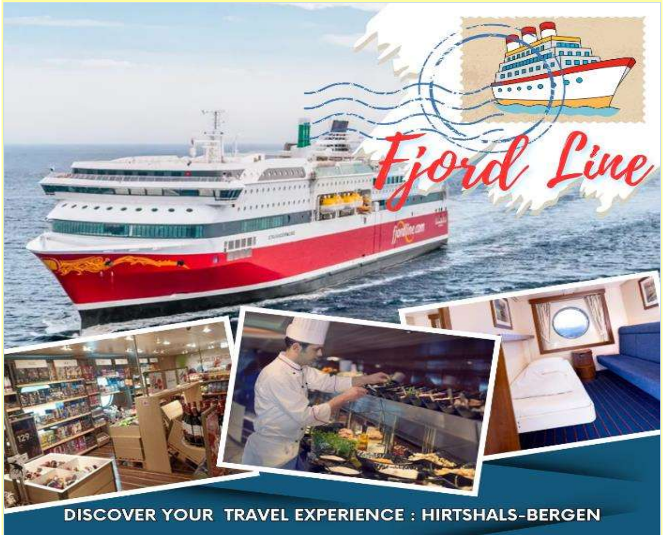
DISCOVER YOUR TRAVEL EXPERIENCE : HIRTSHALS-BERGEN

*** หากท่านต้องการอัปเกรดห้องพักเป็นห้องสวีท กรุณาติดต่อเจ้าหน้าที่ ***