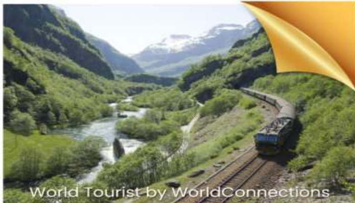
World Tourist by WorldConnections