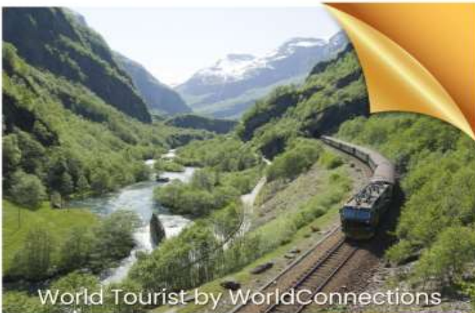
World Tourist by WorldConnections

เมืองหลวงอันคึกคักของฟินแลนด์ ผสมผสานสถาปัตยกรรมของรัสเซียและฟินแลนด์