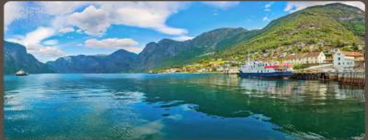
เส้นทางแสนสวย เมืองน่ารัก อากาศดีเยี่ยม

ทัวร์สแกนดิเนเวีย 10 วัน ชมทัศนียภาพที่สวยงามในการสัมผัสประสบการณ์แบบสแกนดิเนเวีย เริ่มต้นด้วยทัวร์เที่ยวชมเมืองโคเปนเฮเกน สวีเดน มาร์ก นอร์เวย์ ฟินแลนด์ และสวีเดน ในแต่ละจุดหมายปลายทาง การเดินทางด้วยรถโค้ช รถไฟ ชมวิว และล่องเรือชมฟยอร์ด สัมผัสประสบการณ์หมู่บ้าน กูเฮา และชนบทของเส้นทางในรูปแบบที่แตกต่างกัน พร้อมกับลิ้มรสอาหารท้องถิ่นหลากหลายเมนู