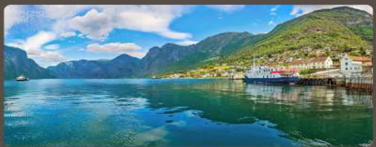
เส้นทางแสนสวย เมืองน่ารัก อากาศดีเยี่ยม

ทัวร์สแกนดิเนเวีย 10 วัน ชมทัศนียภาพที่สวยงามในการสัมผัสประสบการณ์แบบสแกนดิเนเวีย เริ่มต้นด้วยทัวร์เที่ยวชมเมืองโคเปนเฮเกน สวีเดน มาร์ก นอร์เวย์ ฟินแลนด์ และสวีเดน ในแต่ละจุดหมายปลายทาง การเดินทางด้วยรถโค้ช รถไฟ ชมวิว และล่องเรือชมฟยอร์ด สัมผัสประสบการณ์หมู่บ้าน กูเฮา และชนบทของเส้นทางในรูปแบบที่แตกต่างกัน พร้อมกับลิ้มรสอาหารท้องถิ่นหลากหลายเมนู