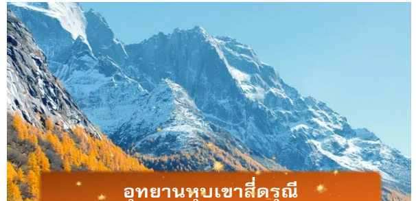
อุทยานหุบเขาสีดรุณี

นำท่านสู่ อุทยานหุบเขาสีดรุณี หรือ กุเหนียงซาน แห่งมณฑลเสฉวน ประเทศจีน (รวมรถอุทยาน) ภูเขาที่สูงเรียงตัวเหนือ-ใต้ยาวกว่า 3.5 กม. ความสูงตั้งแต่ 5,355-6,250 เมตร ปกคลุมด้วยหิมะตลอดปี ราวกับหญิงสาว 4 นางสวมผ้าขาว จึงเป็นที่มาของชื่อ “ภูเขาสีดรุณี” ที่นี่ได้รับฉายา “ราชินีแห่งเสฉวน” และ “เทือกเขาแอลป์แห่งตะวันออก” ด้วยทิวทัศน์อลังการ ทั้งยอดเขากว่า 61 ลูกที่สูงเกิน 5,000 ม., ทะเลสาบ 25 แห่ง และน้ำตกกว่า 120 สาย (ใช้เวลาเดินทางประมาณ 4-5 ชั่วโมง)