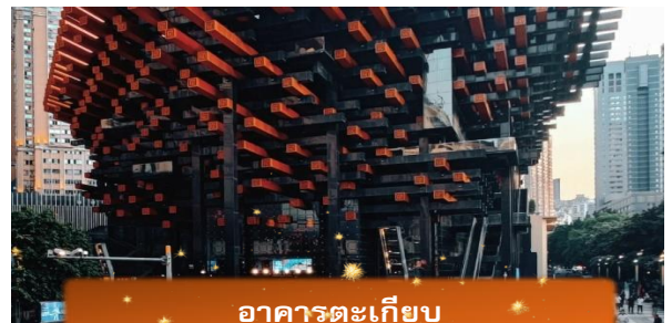
อาคารตะเกียบ

นำท่านถ่ายรูป อาคารตะเกียบ เป็นอาคารที่มีโครงสร้างภายนอกโดดเด่นด้วยลวดลายคานหรือตะเกียบสีแดงและดำที่สานไขว้กัน สร้างภาพเหมือนตะเกียบยักษ์กองเรียงกันไว้ นำท่านเดินทางสู่ ถนนคนเดินเจ็ยฟางเปย คือศูนย์รวมความคึกคักของฉงชิ่งในเวลากลางวัน ที่นี้เต็มไปด้วยห้างสรรพสินค้า ร้านแบรนด์ดัง คาเฟ่เก๋ ๆ และร้านอาหารท้องถิ่นมากมายเดินเล่นเพลินๆ ในบรรยากาศทันสมัย มีจุดเด่นคือ “อนุสาวรีย์ปลดปล่อย” ที่ตั้งตระหง่านอยู่กลางลานรายล้อมด้วยตึกสูงที่สะท้อนแสงแดดระยิบระยับ บรรยากาศสดใส มีชีวิตชีวา นอกจากนี้ยังมีร้านขายของเล่น ป๊อปมาร์ท คลังสมบัติที่นั่นก็ห้ามพลาด