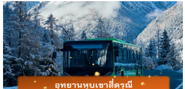
อุทยานหุบเขาสีครุณี

นำท่านเที่ยวชม หุบเขาซวงเจียวโกว เป็นจุดวิวทิวทัศน์ที่สวยงามที่สุด ชมความงามธรรมชาติของซวงเจียวโกว(ลำน้ำสองสะพาน) ธารน้ำมีความยาว 35 กิโลเมตร มีทิวทัศน์ของภูเขาเป็นหลัก, ลำธารผ่านจุดต่างๆที่เป็นจุดทิวทัศน์ ไม่ว่าจะเป็น ซานกัวจวง,เขาหนิวซิน, เย่เหรินเฟิง ถือเป็นจุดท่องเที่ยวแห่งหนึ่งของเขาสีครุณีที่รวบรวมจุดสำคัญหลายๆอย่างเข้าด้วยกันไว้ ชมไฮไลท์จุดชมวิว ได้แก่ ชมหุบเขาหยินหยาง ฟุ้งตันหยาง แล้วเดินทางเข้าสู่ส่วนลึกสุดท่านจะได้เห็นธารน้ำแข็ง ภูเขากระจกแก้ว ภูเขาดวงอาทิตย์ ภูเขาดวงจันทร์ ยอดเขากระท้ายทะเลสาบ และ ฟุ้งหญ้าเหนียนหยูป่า (รวมรถอุทยานแล้วหิมะขึ้นอยู่กับสภาพอากาศ หลังจากนั้นนำท่านเดินทางสู่ เมืองตูเจียงเอี้ยน