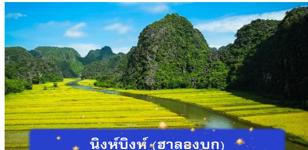
นิงห์บิงท์ (ฮาลองบก)