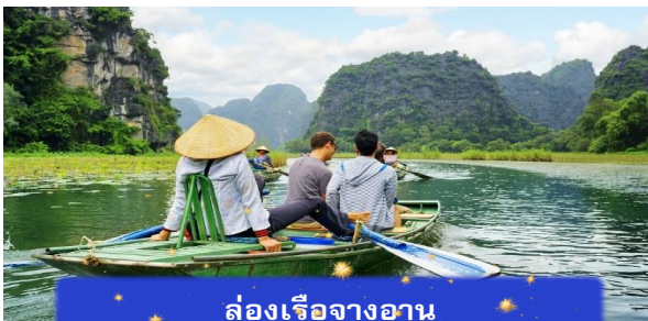
ล่องเรือจางอาน