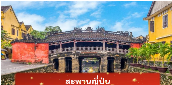
สะพานญี่ปุ่น

เช้า บริการอาหารเช้า ณ ห้องอาหารของโรงแรม จากนั้นนำท่านเดินทางสู่ เมืองโบราณฮอยอัน เมืองมรดกโลกที่ยังคงเอกลักษณ์และรักษาวัฒนธรรมไว้อย่างดีเยี่ยม โดยท่านสามารถเดินเล่น ถ่ายรูป ตามตรอกซอกซอยต่างๆ ได้ ไฮไลท์ของการมาถ่ายรูปเช็คอินที่นี่คือการได้ขึ้นไปถ่ายรูปจากมุมสูงของคาเฟ่ที่อยู่ตามซอกซอย นำท่านชม สะพานญี่ปุ่น สะพานแห่งมิตรไมตรี ที่ได้ชื่อนี้เนื่องจากสะพานแห่งนี้สร้างขึ้นโดยชุมชนชาวญี่ปุ่น เป็นสะพานที่สร้างขึ้นข้ามคลองที่ในอดีต 400 ปีกว่าที่ผ่านมา