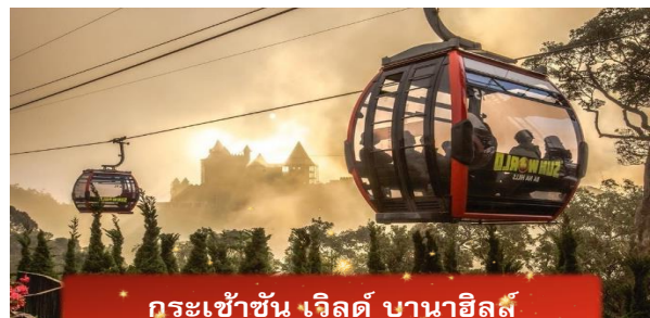
กระเช้าขึ้น เวิลด์ บานาฮิลล์