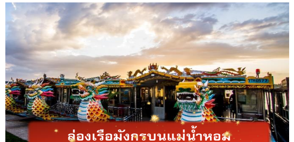
ล่องเรือมังกรบนแม่น้ำหอม

ที่พัก THANH BINH HOTEL ระดับ 4 ดาวมาตรฐานท้องถิ่น หรือเทียบเท่า