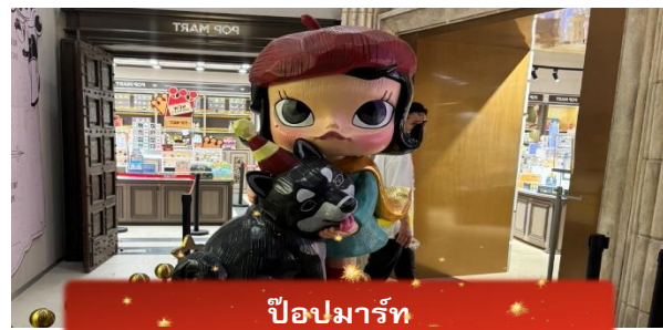
ป๊อปมาร์ท