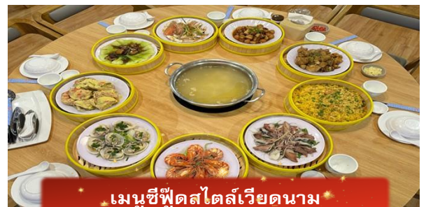
เมนูซีฟู้ดสไตล์เวียดนาม