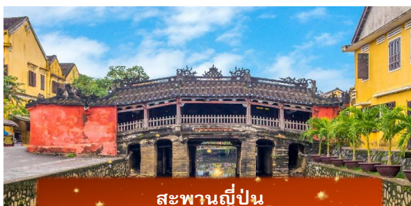
สะพานญี่ปุ่น