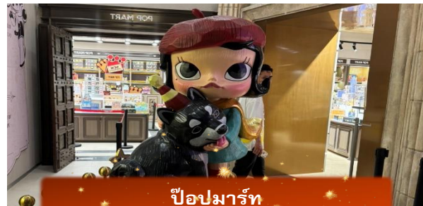
ป๊อปมาร์ท