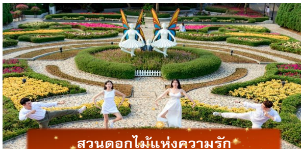
สวนดอกไม้แห่งความรัก