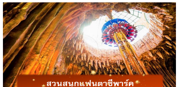
สวนสนุกแฟนตาซีพาร์ค

อิสระท่านท่องเที่ยว สวนสนุกแฟนตาซีพาร์ค ซึ่งมีเครื่องเล่นหลากหลายรูปแบบ เช่น ทำความผจญภัยของหนัง 4D ระทึกขวัญกับบ้านผีสิง เกมส์สนุกๆ เครื่องเล่นเบาๆ รถบั้ง หรือจะเลือกซื้อป๊อปปิ้งของที่ระลึกของสวนสนุก และ จัตุรัสแห่งดวงดาว เปรียบเสมือนการเดินทางสู่อาณาจักรแห่งดวงดาวที่มีเส้นทางเชื่อมต่อระหว่างอาณาจักรแห่งดวงจันทร์และอาณาจักรแห่งดวงอาทิตย์บนที่แสนงดงาม และสถาปัตยกรรมที่ล้ำสมัยจุดเด่นของที่แห่งนี้ก็คือกระจกใสทรงสามเหลี่ยมที่ดูคล้ายกับพิพิธภัณฑสถานลูฟวร์ที่ฝรั่งเศส ให้ความรู้สึกเหมือนท่านกำลังท่องอยู่ในโลกแห่งเวทมนต์และดวงดาว (ไม่รวมค่าเข้าชมหุ่นซีฟิ่ง)