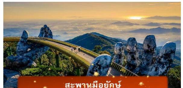
สะพานมียักษ์

นำท่านชม สะพานมียักษ์ แหล่งท่องเที่ยวใหม่ล่าสุดซึ่งอยู่บนเขาบานาฮิลล์ เป็นสะพานสีทองทอดยาวโดยมีมือ 2 ข้างอุ้มไว้ ตั้งอยู่ในตำแหน่งที่โดดเด่นเห็นชัด สวยงาม นำท่านชม สวนดอกไม้แห่งความรัก เป็นสวนดอกไม้สไตล์ฝรั่งเศส ที่มีดอกไม้หลากหลายพันธุ์ถูกจัดเป็นสัดส่วนอย่างสวยงามท่ามกลางอากาศที่แสนเย็นสบาย นำท่านชม สักการะพระพุทธรูปหินอึ้ง เป็นพระพุทธรูปหินองค์ใหญ่ตั้งตระหง่านบนยอดเขาแห่งนี้ ให้ท่านได้ขอพรเพื่อความเป็นมงคล นำท่านชม ป๊อปมาร์ท เป็นร้านค้าของเล่นเปิดใหม่ล่าสุดที่อยู่บนยอดเขาบานาฮิลล์ มีสินค้าของเล่นสำหรับนักจุ่มมากมายให้ท่านได้เลือกชมกับตัวละครน่ารัก อาทิเช่น Molly, SkullPanda, Labubu หมายเหตุ: การจัดการ และข้อกำหนดในการเข้าชมสินค้าอยู่นอกเหนือการจัดการของบริษัททัวร์