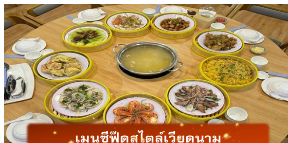
เมนูซีฟู้ดสไตล์เวียดนาม

17.00 เดินทางถึง สนามบินสุวรรณภูมิ โดยสวัสดิภาพ ... พร้อมความประทับใจ