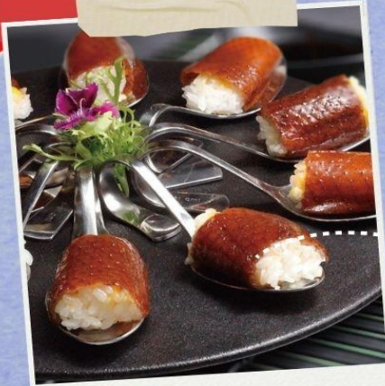
57H QUAN DUCK HOUSE