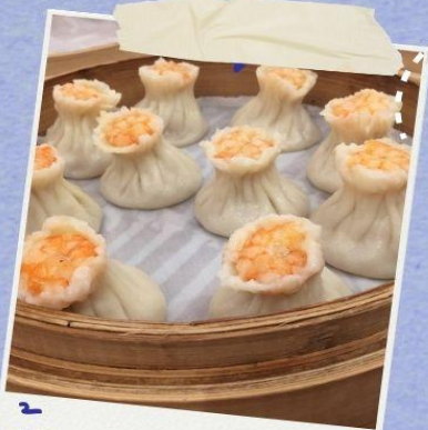
57H DING TAI FONG