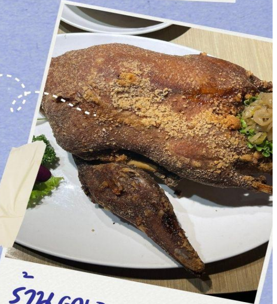
57H GOLDEN FORMOSA