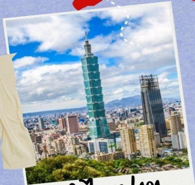
ตึกไทเป 101 (รวมดาขึ้นตึกแล้ว)