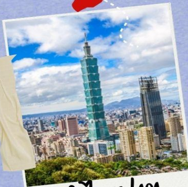
ตึกไทเป 101 (รวมดาจีนตึกแคว)