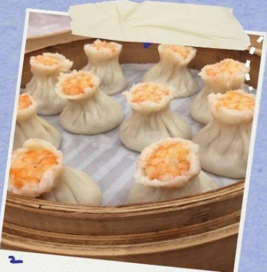
57H DING TAI FONG