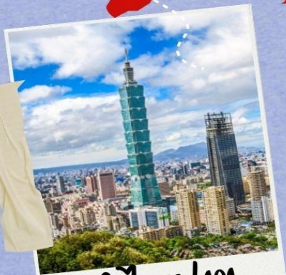
ตึกไทเป 101 (รวมดาขึ้นตึกแล้ว)