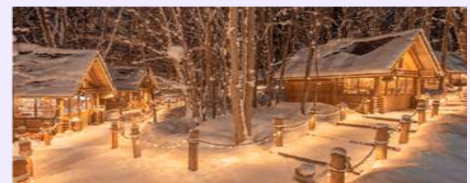
รูปภาพใช้ประกอบการโฆษณาเท่านั้น