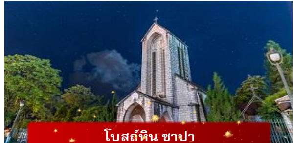
โบสถ์หิน ซาปา