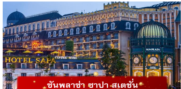
ชั้นพลาซ่า ซาปา สเตชั่น