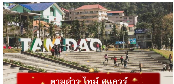
ตามดาว ไทม์ สแควร์

ที่พัก VENUS HOTEL ระดับ 4 ดาวมาตรฐานท้องถิ่น หรือเทียบเท่า