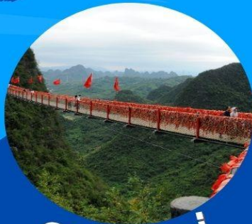
ภูเขาหลุยี่