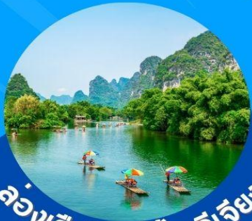
ล่องเรือในแม่น้ำหลี่เจียง