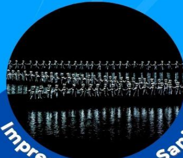
Impression of Liu Sanjie