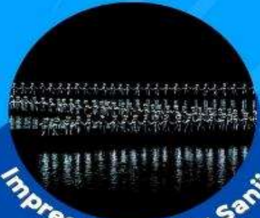
Impression of Liu Sanjie