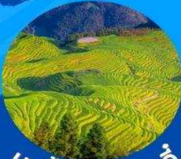
นาขั้นบันไดหลงจิ่ง