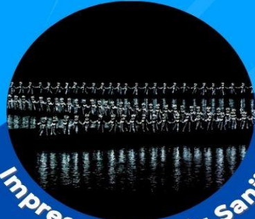
Impression of Liu Sanjie