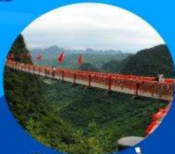
ภูเขาหลุยี่