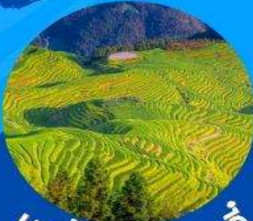
นาขั้นบันไดหลงจิ่ง