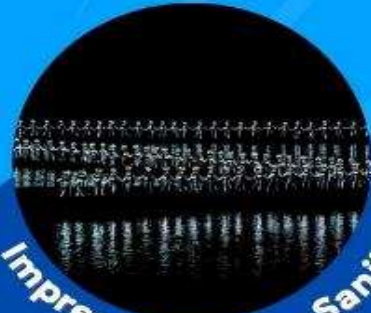
Impression of Liu Sanjie