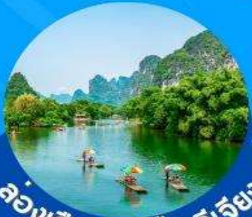
ล่องเรือในแม่น้ำหลี่เจียง