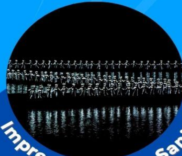
Impression of Liu Sanjie