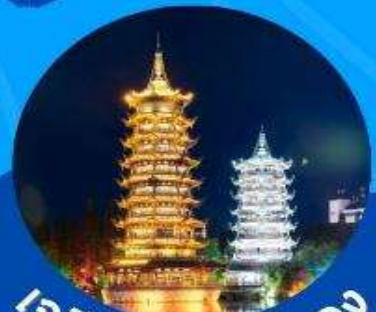
เจดีย์เจิน เจดีย์ทอง