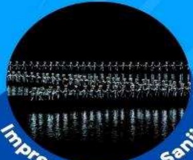
Impression of Liu Sanjie