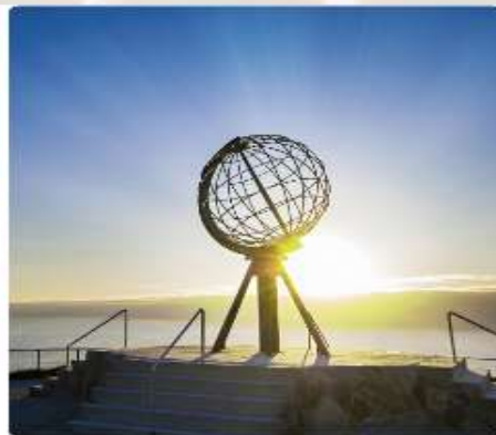
ลับผีสดับแดนไวกิ้ง ชมพระอาทิตย์เที่ยงคืน