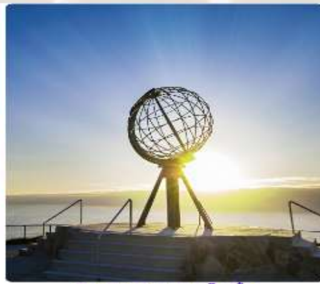
สัมผัสดินแดนไวคิง ชมพระอาทิตย์เที่ยงคืน