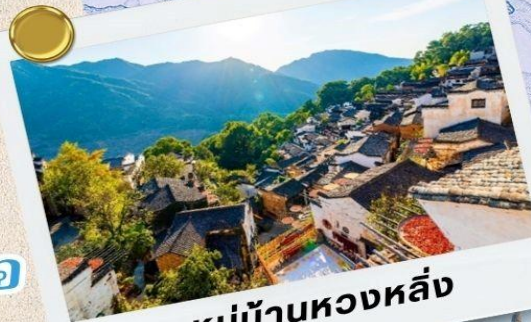
หมู่บ้านหางหลิ่ง