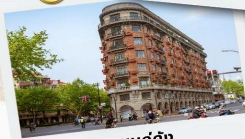
ถนนอู๋คัง