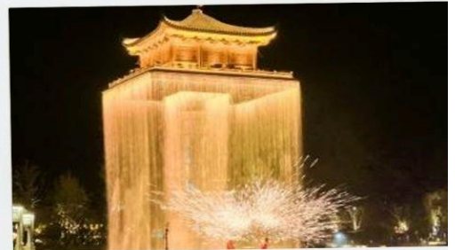
อู๋หนี่วโจว