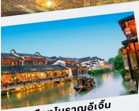
เมืองโบราณอู๋เจิ้น

เชียงใหม่-อู๋เจิ้น-หังโจว-หางหลิ่ง-อู๋หนี่วโจว