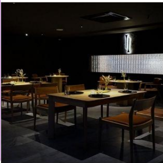
ร้าน Nen Restaurant