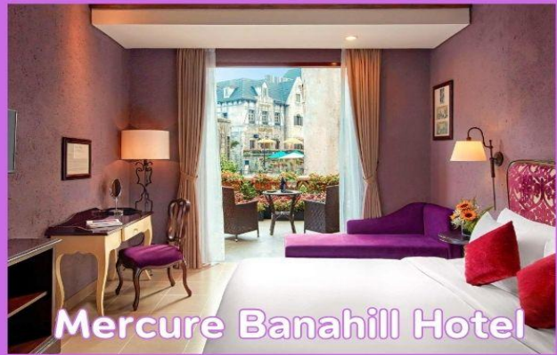
Mercure Banahill Hotel