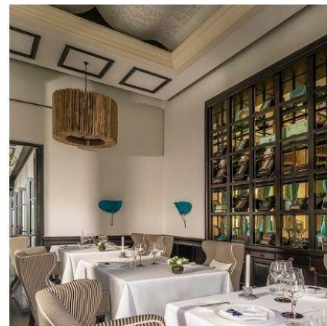
ร้าน La Maison 1888