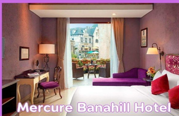
Mercure Banahill Hotel