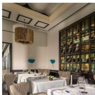
ร้าน La Maison 1888