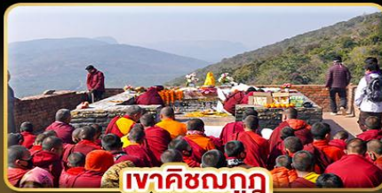
เขาคิชฌกูฏ