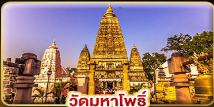
วัดมหาโพธิ์