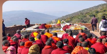
เขาคิชฌกูฏ