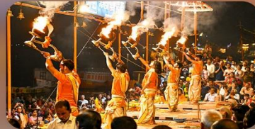
พิธีคงคา อารตี