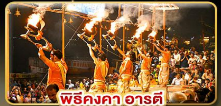
พิธีคงคา อารตี