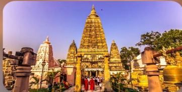
วัดมหาโพธิ์