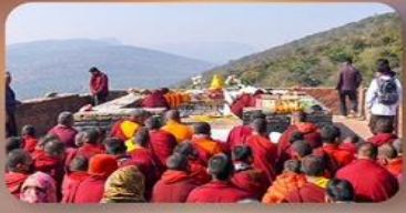
เขาคิชฌกูฏ