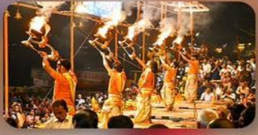
พิธีคงคา อารตี