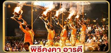
พิธีคังคา อารดี