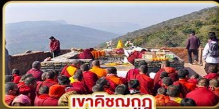
เวาติชฌนกู