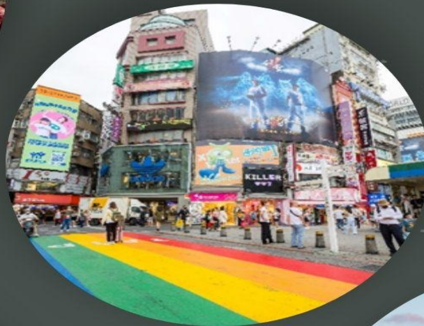
ซีเหมินติง ไนท์มาเก็ต