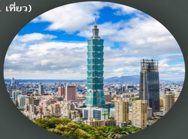
ตึกไทเป 101 (ขึ้นชั้น 89)