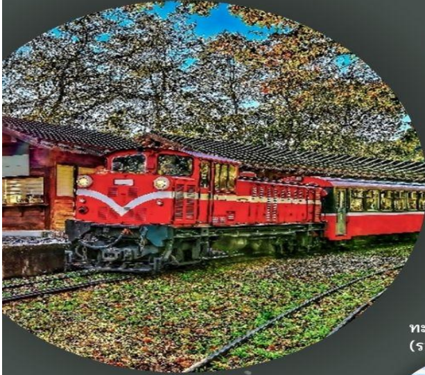
อุทยานอาลีซาน (รวมนั่งรถไฟ 1 เที่ยว)