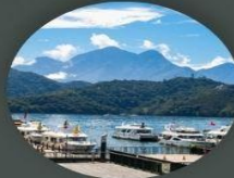
ทะเลสาบสุริยันจันทรา (รวมล่องเรือ)