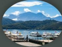
ทะเลสาบสุริยันจันทรา (รวมล่องเรือ)