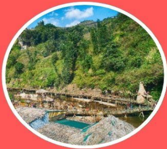
หมู่บ้านชาวเขาก๊ตก๊ต