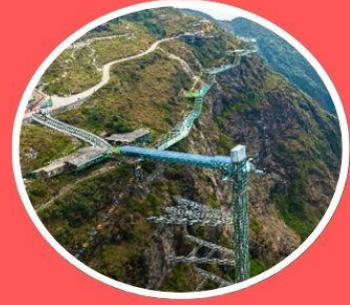
สะพานแกว้มังกรเมฆ