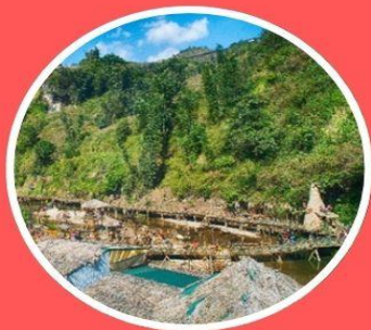
หมู่บ้านชาวเขาก๊ต๊ต