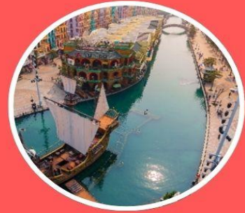
Mega Grand World