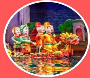
โชว์หุ่นกระบอกน้ำ ถังลอง