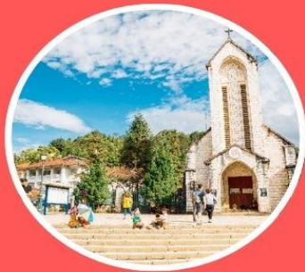
โบสถ์หินซาปา