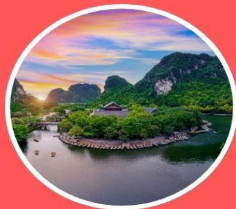
लोंงเรือจ่างอาน