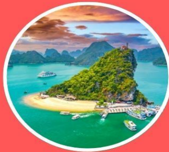
อ่าวฮาลองเบย์