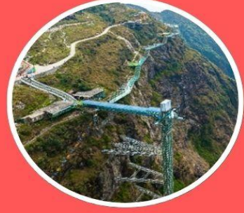
สะพานแก้วมิงกรเมซ